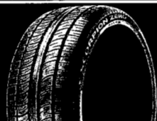
SCORPION ZERO AS